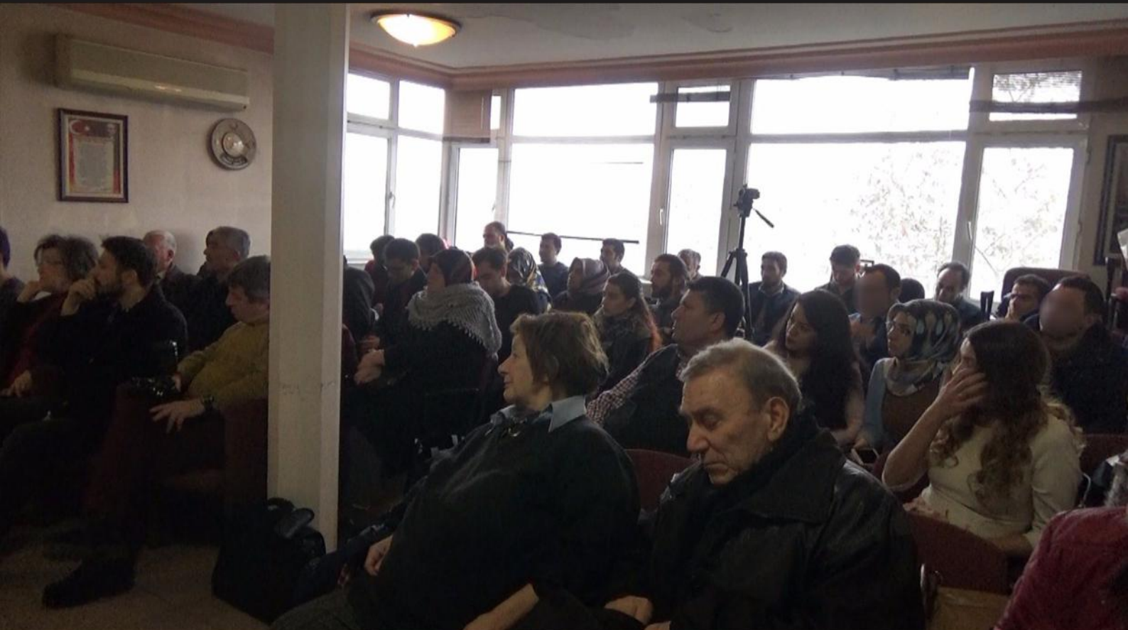
برگزاری کنفرانس «آذربایجان جنوبی، پل طالبی جهان تورک» در آنکارا