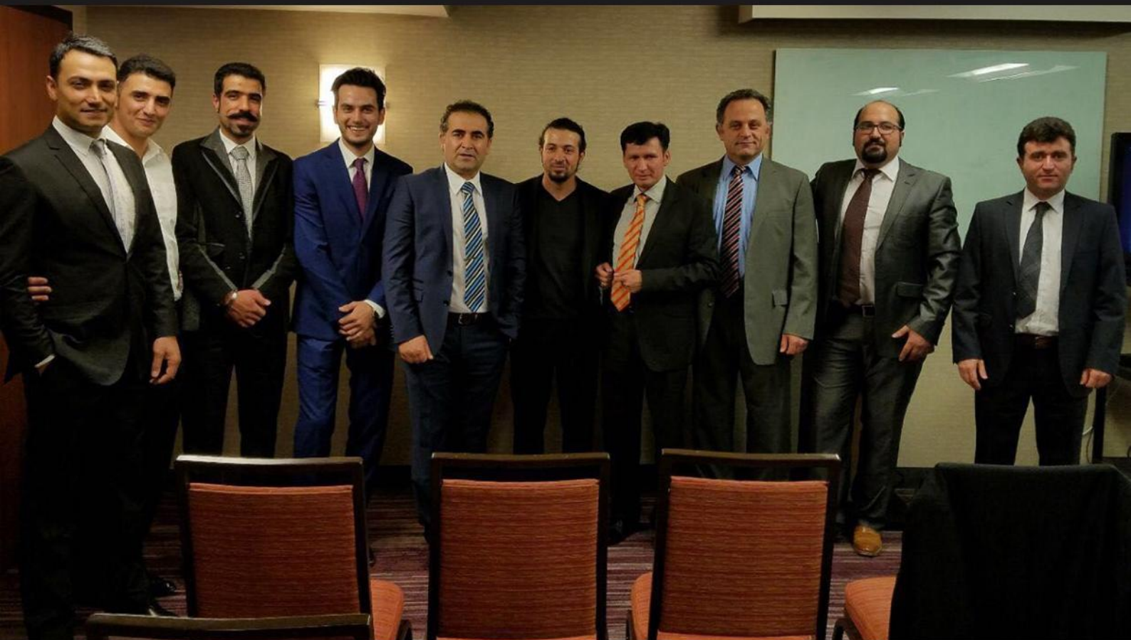
مراسم یازدهمین سالگرد تأسیس تشکیلات مقاومت ملی آذربایجان در واشینگتن