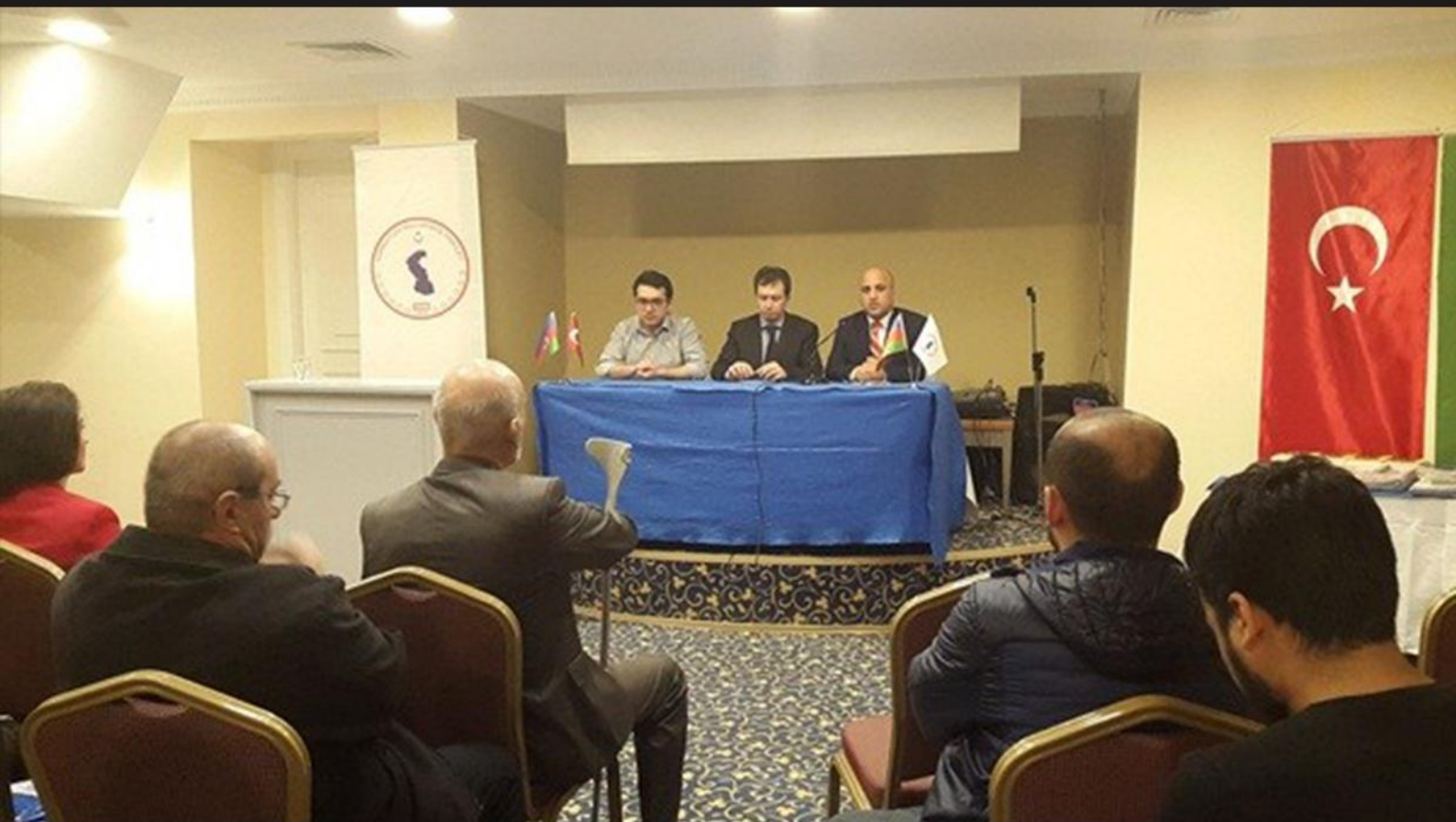
مراسم یازدهمین سالگرد تأسیس تشکیلات مقاومت ملی آذربایجان در آنکارا