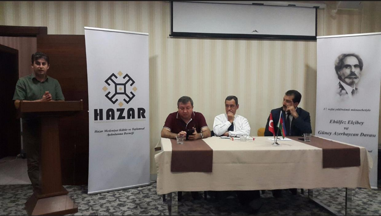
مراسم گرامی داشت ۱۷-مین سالگرد وفات ابوالفضل ائلچے بی