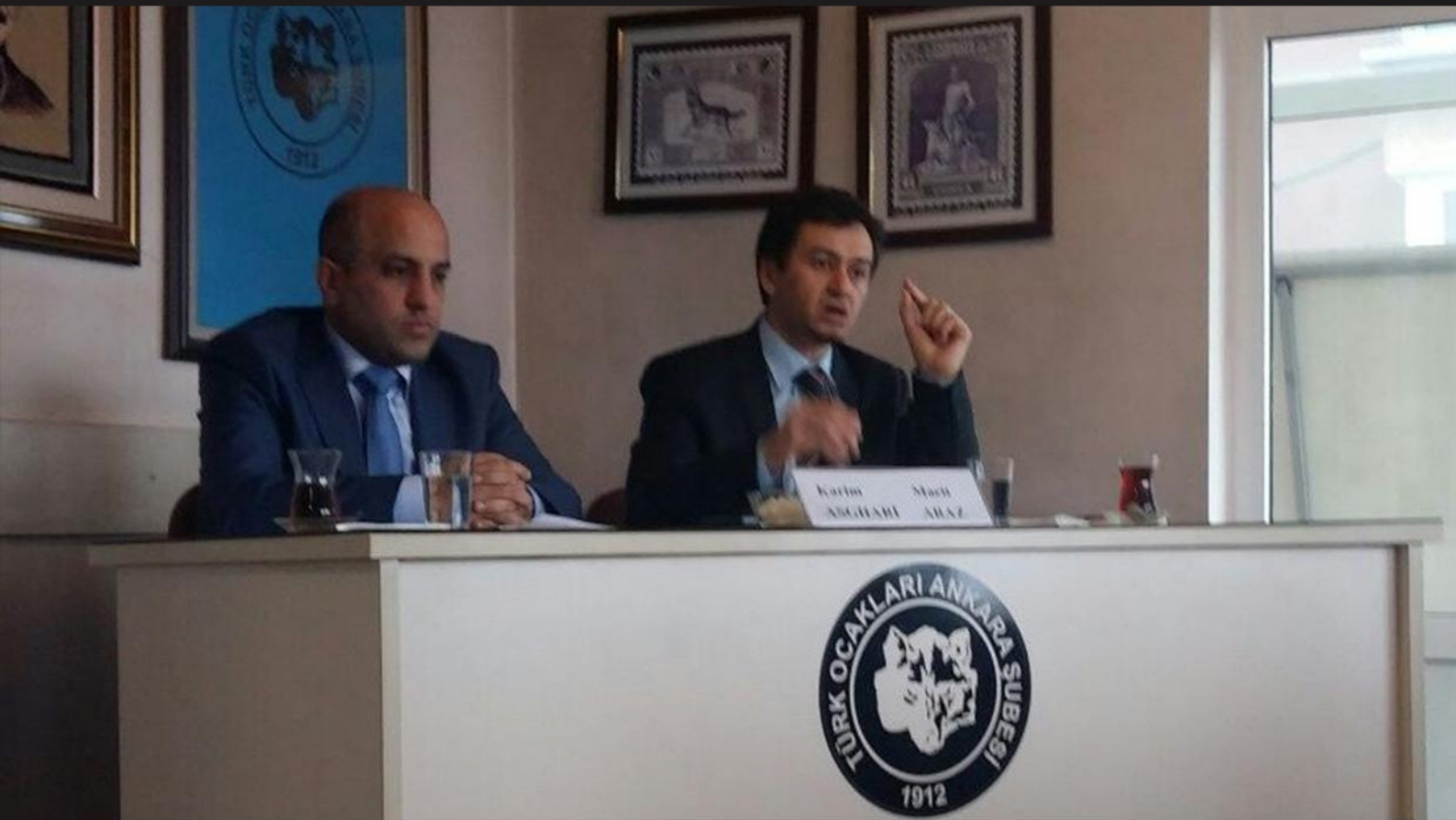
برگزاری کنفرانس «آذربایجان جنوبی، پل طالبی جهان تورک» در آنکارا