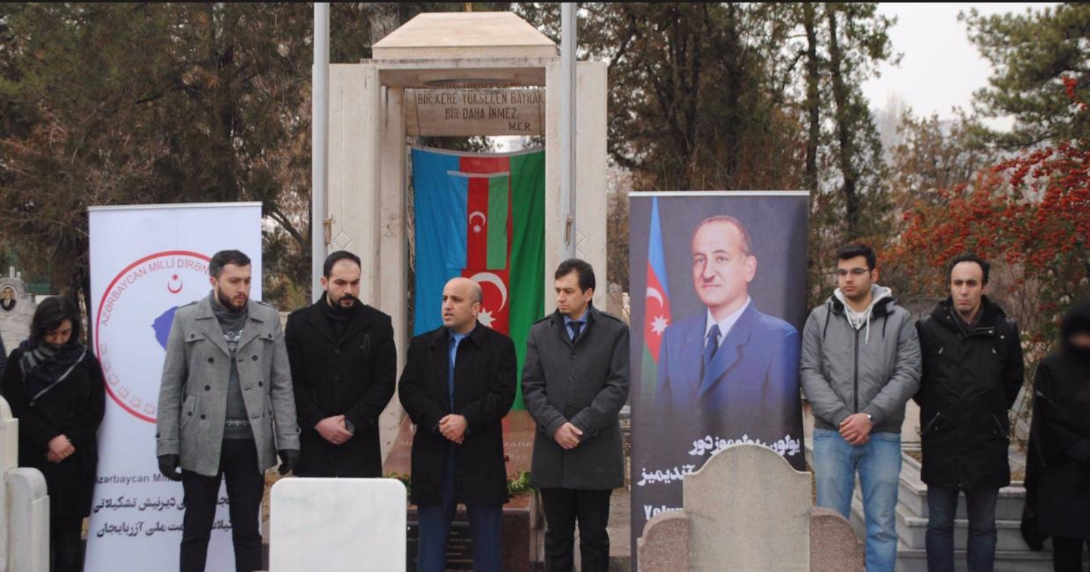
مراسم پیداشت ولادت محمد امین رسول زاده