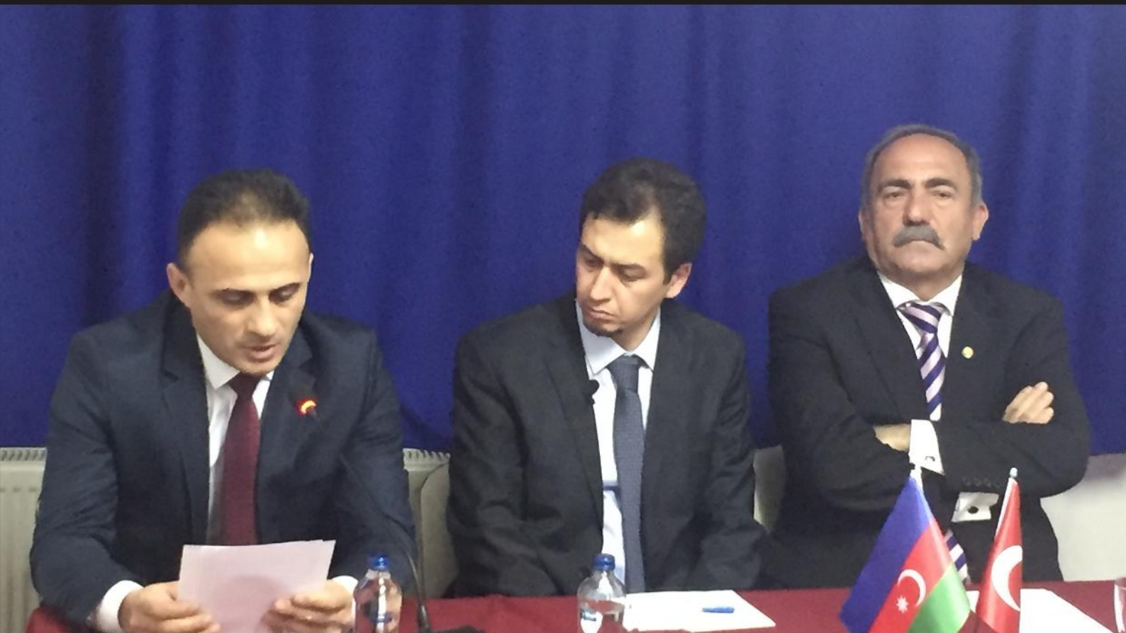
مراسم گرمی داشت ۲۱ آذرو فرقه دمکرات آذربایجان در آنکارا